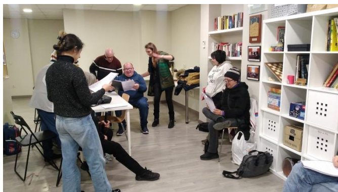
Assajos del repartiment al Club Social Salut Mental Gràcia