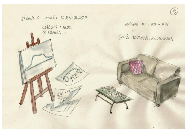
Disseny i construcció de l'escenografia